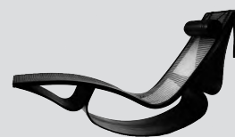
オスカー・ニーマイヤー