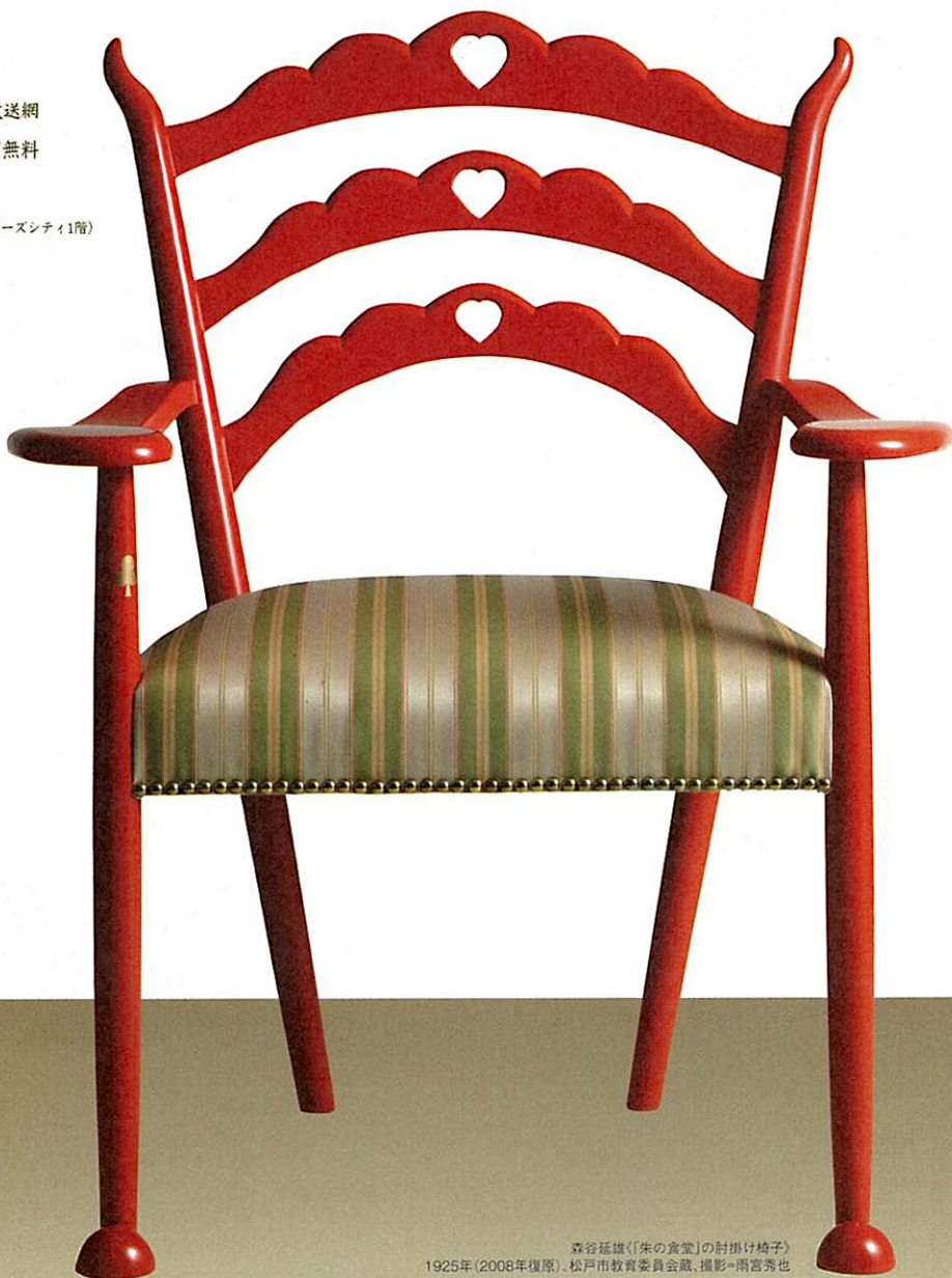
森谷延雄(「朱の食堂」の肘掛け椅子) 1925年(2008年復原)、松戸市教育委員会蔵、撮影=雨宮秀也