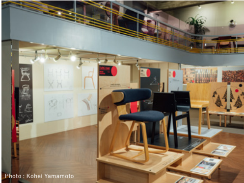
東京支店の展示の様子（2021年7月）