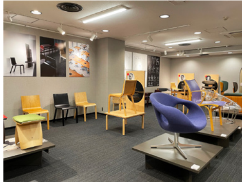
大阪支店の展示の様子（2021年11月）